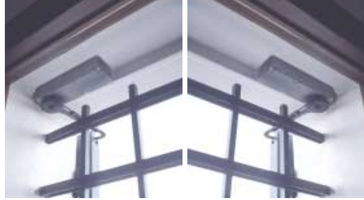
Anwendung mit vom Antrieb getrennter Steuerung